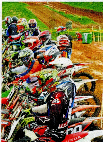
Das Bild zeigt die Startaufstellung beim diesjährigen Osterlauf des MCC Ohlenberg.

Bei einem Le-Mans-Start stehen Fahrer und deren Motocross-Maschinen auf der Start-Ziel-Geraden, allerdings getrennt voneinander. Die Fahrer